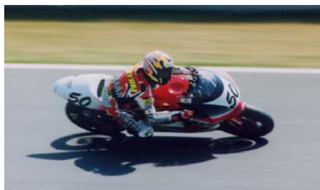
Noriyuki Haga , Suzuka-1998.

Takuma Aoki , Suzuka-1995. Gli venne affidata una Honda NSR 500 del tutto identica a quella del neo campione del mondo, Mick Doohan e, grazie agli innumerevoli chilometri percorsi sulla pista di Suzuka, riuscì a qualificarsi il sabato al terzo posto in griglia e concludere la gara sul gradino più basso del podio.